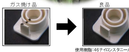
使用樹脂:46ナイロンスタンニール