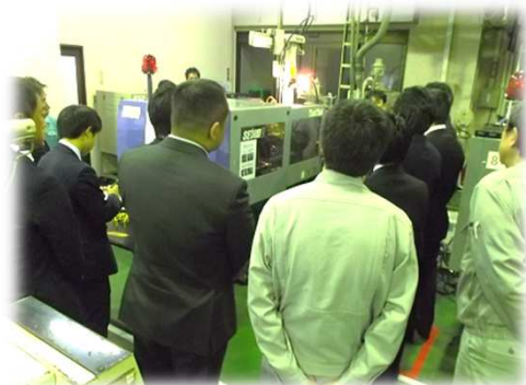
成形工場を見学し、成形の様子を直接見ていただきます