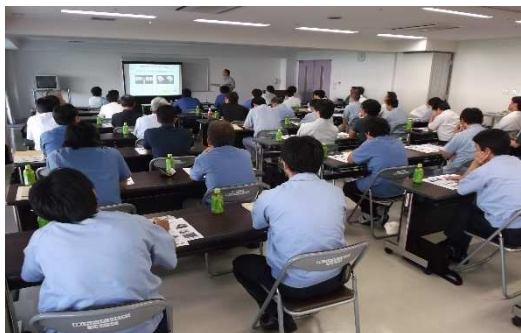
【長野県での講演会の様子】