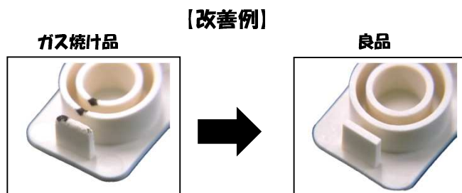
【使用樹脂：46ナイロンスタンニール】