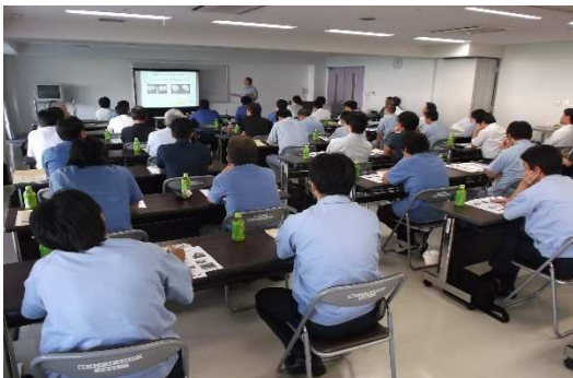
【長野県での講演会の様子】