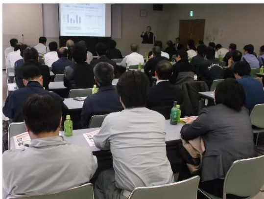
【神奈川県での講演会の様子】