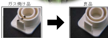
使用樹脂:46ナイロスタニール