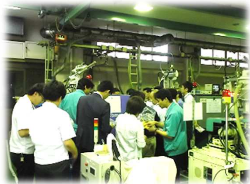
成形工場を見学し、 成形の様子を直接見ていただけます