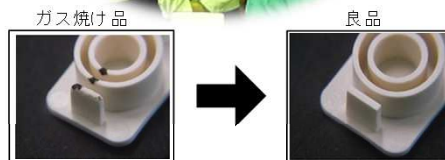
使用樹脂:46ナイロスタニール