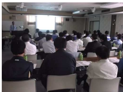
【富山県での講演会の様子】