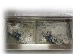
超音波洗浄 (イメージ)